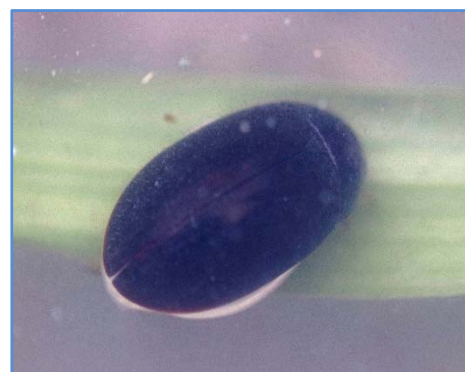
ヒメガムシ（泳ぐスイカのタネ?）